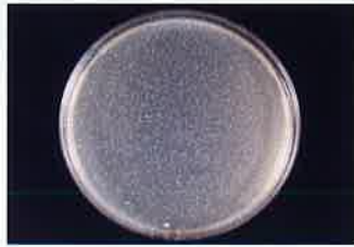
MRSA 保存24時間後 検体噴霧なし