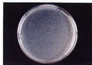
MRSA 保存20分後 検体噴霧なし