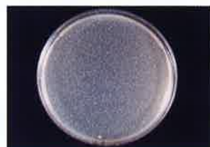
MRSA 保存24時間後 検体噴霧なし