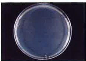
MRSA 保存24時間後 検体噴霧あり