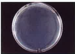
MRSA 保存20分後 検体噴霧あり