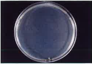
MRSA 保存24時間後 検体噴霧あり