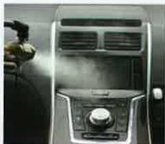
電装部分にも 安心除菌、抗菌