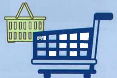
スーパーの買物カゴやカートに