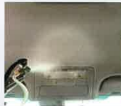
上向きでも ラクラク除菌、抗菌