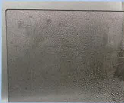
スプレーボトル 2回噴霧