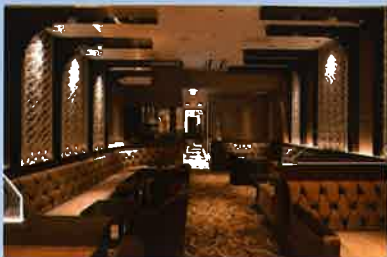
飲食店内の除菌、抗菌に