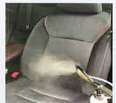
シートも 濡らさず除菌、抗菌