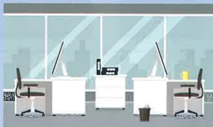
電子機器の多いオフィスにも安心