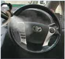
ハンドルも濡らさず 除菌、抗菌